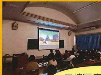
長崎医療技術専門学校