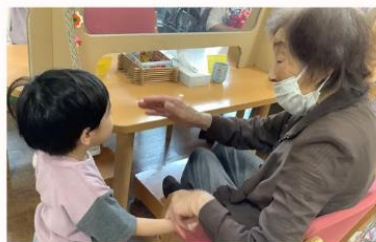
保育園とふれあい