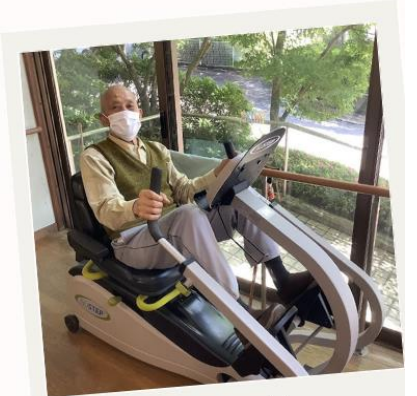
運動あり (機能訓練)