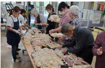
パン屋の移動販売